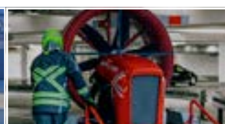
L 125 F3