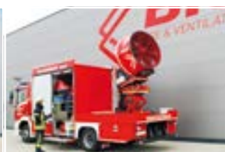
L125 TASK XL