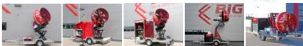
L125 ACTION S