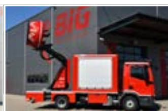
XP 125 TASK XL